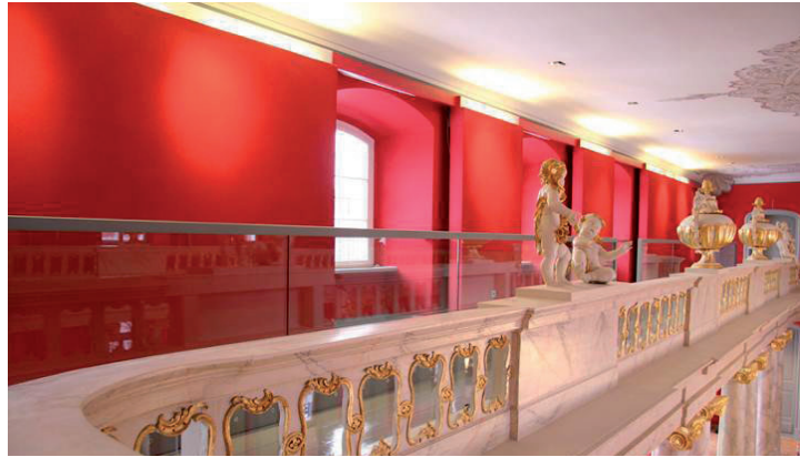
Historische barocke Aula, Ernst-Moritz-Arndt-Universität Greifswald Entwurfsverfasserin: Innenarchitektin Dipl.-Designerin (FH) Heidrun Walter, walter + planer architekturbüro / raumbildender ausbau, Rostock